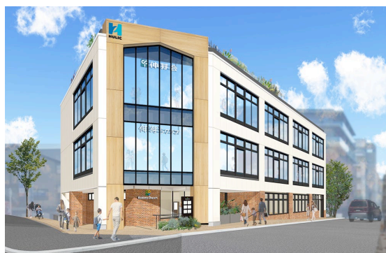
「こどもでぱーとたまプラーザ」外観