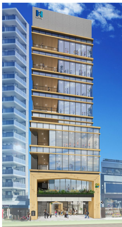
「こどもでぱーと中野」外観